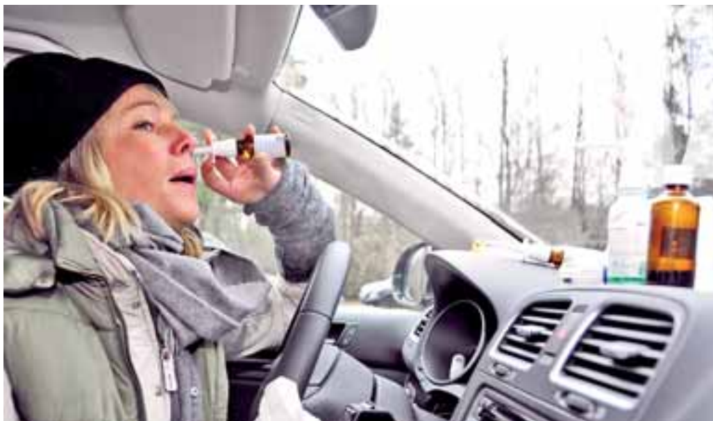
Eine Fahrt unter Medikamenteneinfluss gleicht nicht selten einer Fahrt unter Alkoholeinfluss.

schlechter, wird das Fahrvermögen von Erkälteten oder an Grippe Erkrankten durch die Einnahme von Medikamenten. Auch Mittel, die nicht verschreibungspflichtig sind, können die Fahrtüchtigkeit erheblich einschränken. So weist die Apothekerkammer in Hamburg darauf hin, dass auch scheinbar harmlose Arzneien, die ohne Rezept erhältlich sind, sich negativ auf das Fahrvermögen auswirken können – erst recht nach eigener und möglicherweise falscher Medikation. Allein schon die in vielen solcher Mittel enthaltenen stimulierenden Wirkstoffe können dem Fahrer suggerieren, er wäre fit für den Straßenverkehr. In Wirklichkeit ist er jedoch schlapp und krank und gehört eigentlich ins Bett statt ans Lenkrad.