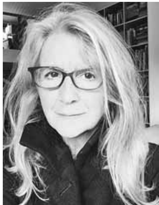
Die Regisseurin Sally Potter