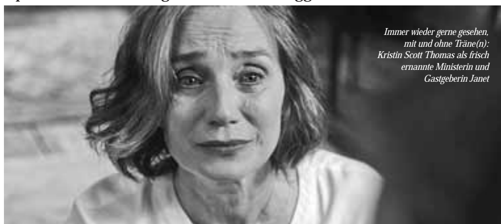
Immer wieder gerne gesehen, mit und ohne Träne(n): Kristin Scott Thomas als frisch ernannte Ministerin und Gastgeberin Janet

Gastgeberin, blendend dargestellt von Timothy Spall, ist todkrank, aber das ist nicht der Grund, warum er erst röchelnd, dann nicht mehr röchelnd und später wieder röchelnd am Boden liegt. Das ist eine scharfsinnig ironisch-komische und groteske Komödie mit Tiefgang in Schwarz-Weiß gefilmt. Warum? „Schwarz-Weiß gibt (dem Zuschauer) einen speziellen Raum für Emotionen“, erklärt die Regie, und genau die sind zum Teil äußerst heftig. Bruno Ganz ist eine unserer Lieblingsfiguren in diesem Kabinettstück. Er strömt eine therapeutische Art von Komik aus. Man prustet los, und dann bleibt einem wieder das Lachen im Halse stecken. Regisseurin Sally Potter wollte, seitdem sie ihn in „Himmel über Berlin“ gesehen hat,