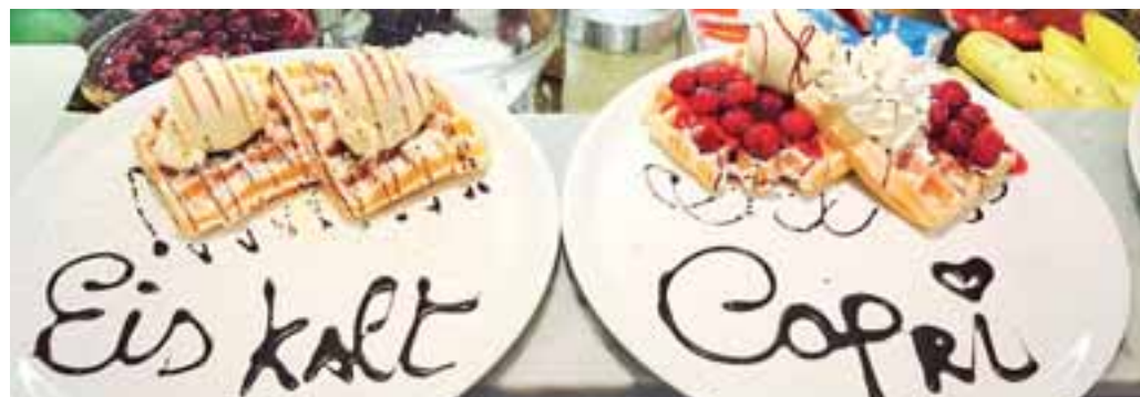
Jede „Magic Waffel“ hat mindestens drei Zutaten und wird nach Wunsch ganz individuell gestaltet.

über die App „Eiscafé Capri Eschweiler“, die man sich auf jedes Smartphone herunterladen kann. Typisch „Capri“ eben. Neben dem beliebten Frühstück, leckeren Kuchen- und Kaffeespezialitäten, Longdrinks, Spirituosen und vielem mehr ist es natürlich vor allem auch das hausgemachte original italienische Eis, das die Gäste so sehr lieben und das auch die Gastronomie überaus schätzt. Haben Sie neulich köstliches Eis im Restaurant genossen? Dann könnte es durchaus „made by Capri“ gewesen sein. Das Eiscafé freut sich auf Ihren Besuch. In der Winterzeit ist das „Capri“-Team an jedem Tag (außer sonntags) von 8.30 bis 19 Uhr für Sie da.