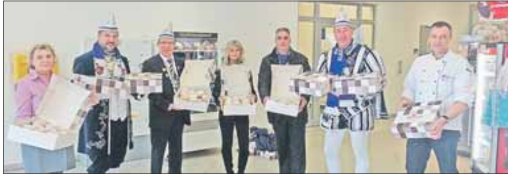
250 „Berliner“ übergab die prinzliche Delegation dem Krankenhaus.

wie warme Semmeln. In 111 närrischen Minuten gingen sage