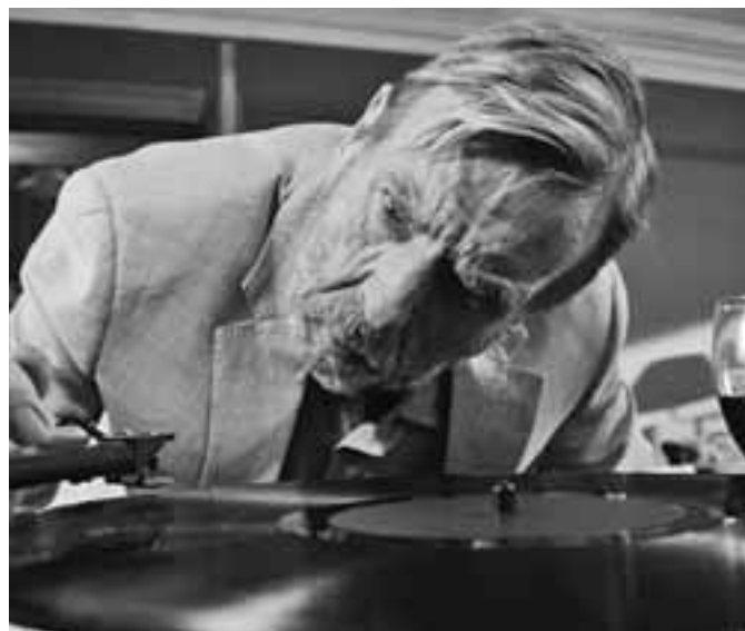
Timothy Spall als todkranker Gastgeber. Rotwein und die richtige Musik zur passenden Katastrophe halten ihn aufrecht oder auch nicht.

unbedingt mit ihm drehen, eines Tages. Dieser Wunsch ging nun in Erfüllung. Die dynamischste und jüngste Figur in diesem Reigen ist ein irischer Banker. Seine erste Frage: „Wo ist die Toilette?“ Den Ausdruck „rearrange the Willy“ kennt man aus diversen Filmen, unter anderem aus „Tote tragen keine Karos“. Diese Art Problem bezieht sich bei ihm eher auf die Wumme. Die vielen ledernen Halfter-Riemchen halten sie zwar, aber der schicke und überbeuerte Anzug sitzt so gut und eng, dass es ihm schwer fällt zu verheimlichen, ob er nun Pistolen- Links- oder Rechts-Träger ist. Dann schnell noch je eine Strecke Koks in die Nasenlöcher, den Schweiß abgeputzt und rein ins Wohnzimmer, in dem die Stimmung schon angeheizt ist. Beifall für Cillian Murphy, der in seiner Rolle mehrfach unfreiwillig Murphys Gesetz bestätigt. Die Dialoge kommen wie aus Maschinengewehren, sind scharfkantig und treffen stets ins Schwarze. Der verbale Schlagabtausch hat ein perfektes Timing und wird durch eine weitere Dimension von SMS-Nachrichten an die Gastgeberin (Kristin Scott Thomas) ergänzt. Fulminant!