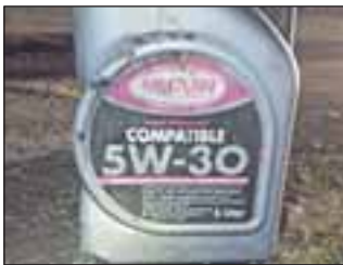
Der leere Ölbehälter konnte am Straßenrand aufgefunden werden.

Eschweiler. Am 08.02.2017 haben unbekannte Täter auf der Straße Im Hasselt auf einer Länge von etwa 100 Metern einen großen Kanister mit Motoröl ausgeschüttet und dadurch eine erhebliche Gefahrenstelle für den Verkehr verursacht. Aufgrund der sehr unüblichen Verteilung ist von einer vorsätzlichen Handlung auszugehen. Da die Feuerwehr schnell vor Ort war und die Sicherung der Gefahrenstelle übernommen hat, ist niemand zu Schaden gekommen.