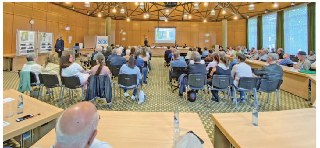
Rund 50 Anwohner nahmen am Informationsabend zu den Flüchtlingsunterkünften teil.