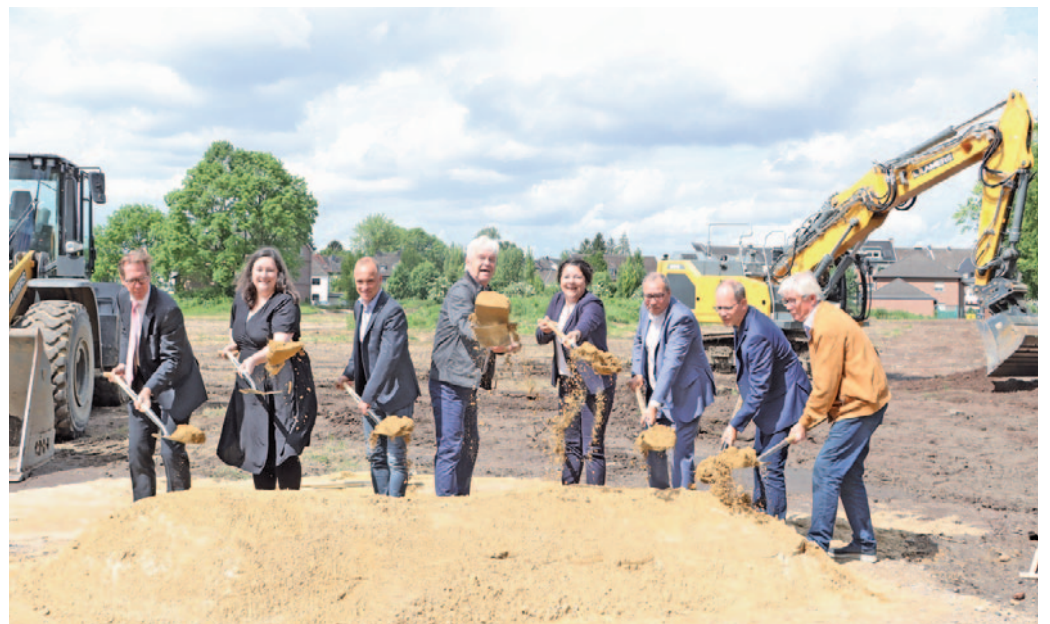
Vertreter der Stadt, der Strukturfördergesellschaft und von S-Immo setzen den symbolischen ersten Spatenstich.

Die Bauarbeiten von „Südlich Patternhof“ sind mit dem symbolischen Spatenstich nun offiziell gestartet. Insgesamt werden 25 Grundstücke, die eine Fläche von 13.000 Quadratmetern umfassen, durch S-Immo vermarktet. Geplant sind 12 Doppelhaushälften, sechs freistehende Einfamilienhäuser, drei zweigeschossige