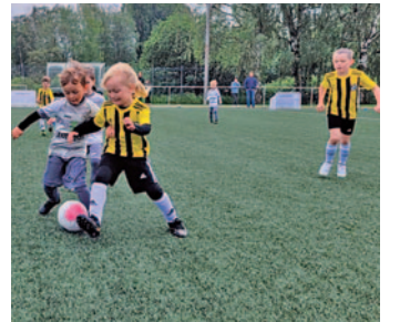
Kleine Teams, mehr Tore, kurze Spiele beim neuen Kinderfußball.

Ab Sommer führt der Deutsche Fußball-Bund bei Bambini, F- und E-Jugend verpflichtend neue Spielformen ein. Beim Funino oder Kifu (Kinderfußball) wird auf kleinerem Feld meist 3-gegen-3 auf vier Kleinfeldtoren (zwei pro Team) ohne Torhüter gespielt. Ligen mit Tabellen gibt's nicht mehr, dafür „Festivals“ – so wie am Samstag beim SC Berger Preuß, als sich die Bambinis der Gastgeber und von FC Eschweiler, Falke Bergrath, VfL Vichtal und JFC Alsdorf zum Turnier trafen. Auf den 5 Feldern mit total 20 Minutoren, die der Verein ohne DFB-Zuschuss anschaffen musste, zeigen die 8-Minuten-Partien die Vorteile: Alle Kinder nehmen mit Ballaktionen am Spiel teil, sollen sich so besser entwickeln und mehr Spaß haben. Die Gewinner rücken immer ein Feld