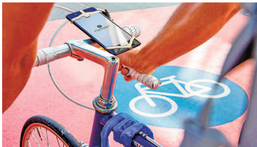
Die Ergebnisse vom Stadtradeln in der StädteRegion Aachen stehen fest.