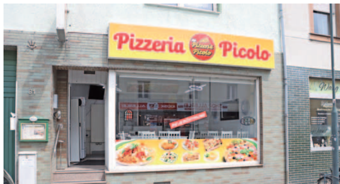
Pizzeria Pico befindet sich in der Dürener Straße 81 direkt hinter dem Rathaus.