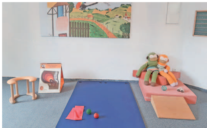
Der Verein versteht sich seit 25 Jahren als feste Anlaufstelle für (werdende) Familien.

In 25 Jahren hat sich der Storchenbiß zu einer festen Anlaufstelle für (werdende) Familien in und rund um Eschweiler etabliert. Das heutige Team besteht aus Mitarbeitern aus dem medizinischen, pflegerischen und pädagogischen Sektor, die eng vernetzt mit Einrichtungen wie der AWO, dem SkF und dem Jugendamt arbeiten. Das aktuelle Angebot erstreckt sich von Geburtsvorbereitungskursen, über die Gymnastik vor und nach der Geburt bis hin zu Eltern-Kind-Kursen. Darüber hinaus finden regelmäßige Austauschangebote wie der Storchentalk und der Vätertreff statt. Abgerundet wird das Angebot durch Informationsveranstaltungen und Workshops zu den Themen Babyhandling, Ernährung, Erste Hilfe und vielem mehr. „Trotz der Erweiterung des Angebots steht für uns immer noch die Betreuung der Eltern im Fokus“, sagt Annemarie de Lange. Der Storchenbiß bietet kostenfreie Einzelberatungen zu vielfältigen Themen rund ums Elternsein (Schlafen, Eigenständigkeitsentwicklung, Stillen/ Ernähren,