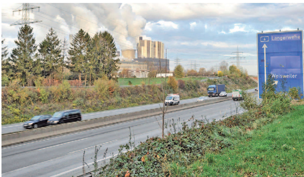
Am Standort des Kraftwerks Weisweiler möchte sich das RWE weiterhin engagieren und plant Erkundungsbohrungen für Tiefenwärme.

Vor dem Kraftwerk Weisweiler wird voraussichtlich im September die erste Bohrung niedergebracht, um den Untergrund auf der Suche nach Tiefenwärme zu erkunden. Die Bohrung ist Teil des internationalen Projekts DGE-ROLLOUT und wird von RWE Power, einem der zahlreichen Projektpartner, ausgeführt. Das Unternehmen hat jetzt bei der Bezirksregierung Arnsberg, der Aufsichtsbehörde des Bergbaus, den Hauptbetriebsplan für die Bohrungen eingereicht und damit die Genehmigung beantragt. Das EU-Projekt „Roll-out of Deep Geothermal Energy in North-West Europe – DGE-ROLLOUT“ wird vom Geologischen Dienst NRW geleitet. Am Standort Kraftwerk Weisweiler engagieren sich RWE Power und die Fraunhofer-Einrichtung für Energieinfrastrukturen und Geothermie IEG.