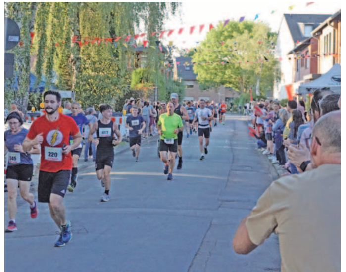
Zum Lauf am 5. August wird in der Martinstraße Hawaii-Feeling aufkommen.

Was den von der Filmpost präsentierten Internationalen Volks- und Straßenlauf („Die 10 Kilometer von Dürwiß“) von anderen Laufveranstaltungen abhebt, ist die Strecke mitten durch den Ort und die dadurch entstehende Atmosphäre. Am Samstag, 5. August, werden in den Vorgärten, auf den Auffahrten und Bürgersteigen wieder Nachbarn, Familien und Freunde miteinander das sportliche Spektakel vor der Haustür genießen und die Athleten kräftig anfeuern. Der Veranstalter SV Germania Dürwiß zählt etwa 30 angemeldete Straßenpartys, die von den Organisatoren unterstützt werden. Inoffiziell sind es noch mehr.