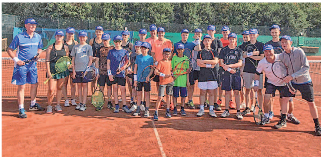
Das Feriencamp bei der ESG Tennis findet vom 31. Juli bis zum 4. August statt.

Die Tennis-Sommersaison läuft. Das bedeutet, endlich wieder „Bälle Schlagen“ an der frischen Luft und bei Sonnenschein. Die ESG-Tennisabteilung bietet hierfür genau das richtige Umfeld. Acht gepflegte Außenplätze und ein großes Clubhaus – samt Sonnenterrasse und ganzjährig geführter Gastronomie – erwarten die Clubmitglieder. Für alle diejenigen, die Interesse am Tennissport zeigen und gerne das Clubleben kennen lernen möchten, wäre eine Teilnahme am diesjährigen Tenniscamp (31. Juli bis 4. August) genau das Richtige. Die-